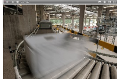
Bild: Kiste mit Bestellung auf dem Weg vom Hochregallager in die Verpackungs-Abteilung

https://www.youtube.com/watch?v=Lt3G77qbWGE&feature=youtu.be