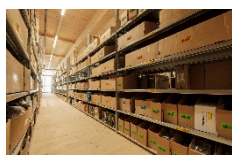
Bild: Halbautomatisierter Picktower für kleinere Artikel

https://www.digitec.ch/MWS/Release/170905_Medienmitteilung/wohlen_3.jpg