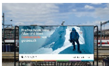
Galaxus Live Kampagne, Plakat am Hauptbahnhof Zürich

300dpi: https://www.digitec.ch/MWS/Release/160113_Medienmitteilung/Logistikzentrum.jpg