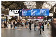
Photo : Campagne politique Galaxus dans la gare centrale de Zurich

https://www.digitec.ch/MWS/Release/180108_Medienmitteilung/Warenlager-Wohlen.jpg