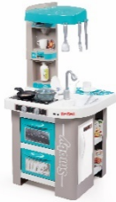
Bild: Smoby Tefal Studio Bubble

https://www.digitec.ch/MWS/Release/171218_Medienmitteilung/Cyclone.jpg