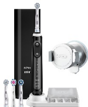
Bild: Oral B Genius

https://www.digitec.ch/MWS/Release/171218_Medienmitteilung/Alienware.jpg