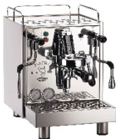
Bild: Bezzera Magica

https://www.digitec.ch/MWS/Release/171218_Medienmitteilung/De_Longhi.JPEG