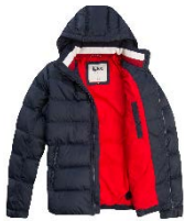
Bild: Tommy Hilfiger Basic Down

https://www.digitec.ch/MWS/Release/171218_Medienmitteilung/Bartpflege.jpg