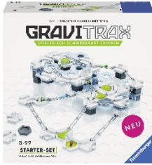
Bild: Ravensburger GraviTrax-Starterset

https://www.digitec.ch/MWS/Release/171218_Medienmitteilung/Gravitrax.jpg