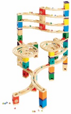
Bild: Hape Quadrilla Cyclone

https://www.digitec.ch/MWS/Release/171218_Medienmitteilung/Gravitrax.jpg