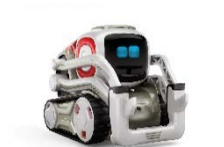
Bild: Anki Cozmo

https://www.digitec.ch/MWS/Release/171218_Medienmitteilung/Karma.jpg