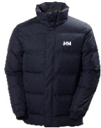
Bild: Helly Hansen Dubliner Down

https://www.digitec.ch/MWS/Release/171218_Medienmitteilung/Tommy_Hilfiger.jpg