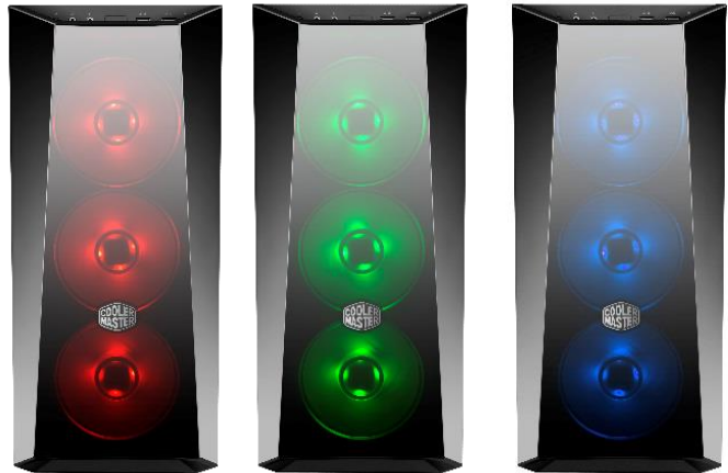
Drei vormontierte RGB Lüfter