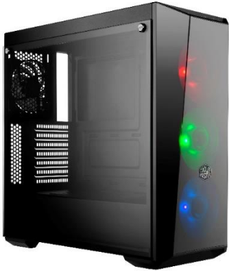
Unterstützung für 4 Lüfter und 2 Radiatoren