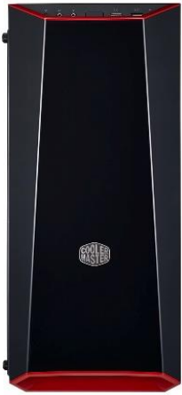
Vorderseite in DarkMirror-Ausführung